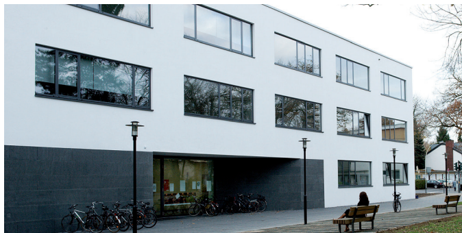
Lehrgebäude - Gebäude Universitätsklinikum Bonn